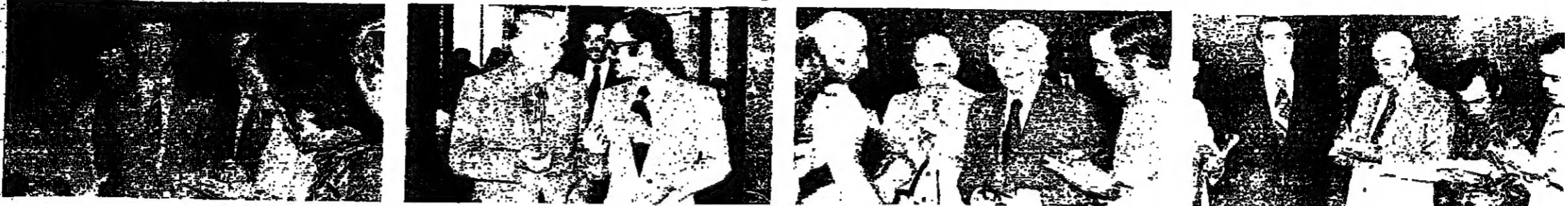
الرئيس أمين الحافظ يتحدث الى الصحفيين ■ النائبان ادوار حنين وجميل روحانا صقر ■ حيث يتبادل بين النائبين طوني فرنجية وعثمان